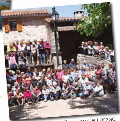
Les 10 ans sur le Larzac

Et au Pérou, sur le lac Titicaca, une bonne occasion de rassembler nos amis d'Amérique du Sud dans un point central et de renforcer toujours plus les liens qui donnent à nos voyages un goût inimitable !