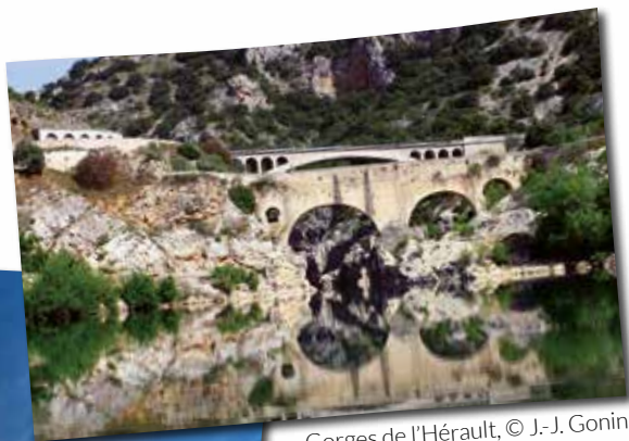
Gorges de l'Hérault